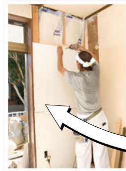
耐震改修パネルを取り付ける。