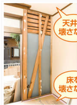
むきだしの壁内部。