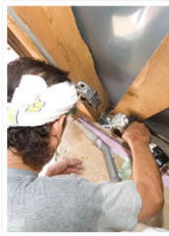
補強用の金物をつける。