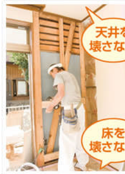
パネルを固定する横桎をつける。